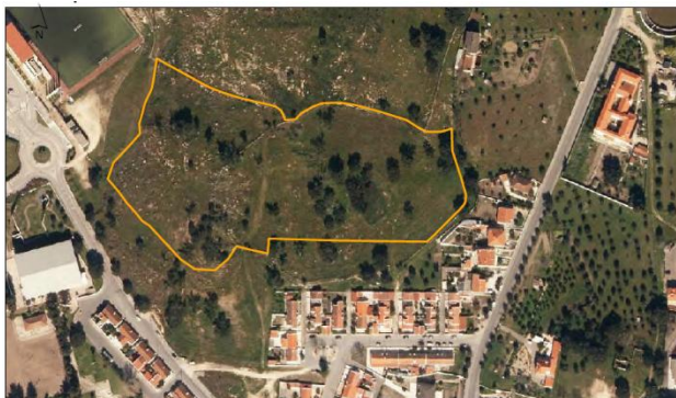
Parcela Nome: Tapada da Forca Área: 3,10 ha Nº de Predicação: 50 Localidade: Crato Ocupação de Solo: Pastagem sob coberto sobre