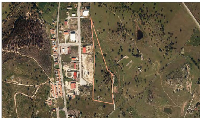
Parcela Nome: Zona Industrial Área: 4,22 ha Nº de Predicação: NA Localidade: Flor da Rosa Ocupação de Solo: Pastagem