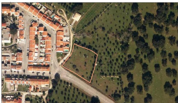
Parcela Nome: Bandelha Área: 0,42 ha Nº de Publicação: 76 0 Localização: Crato Ocupação de Solo: Citral, pastagem