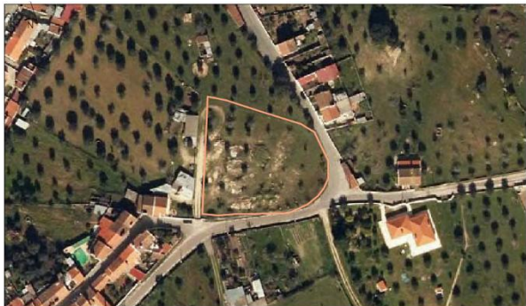
Parcela Nome: Fonte de Odeon Área: 0,32 ha Nº de Predicação: 192 D Localidade: Alameda da Moura Ocupação de Solo: Ovinos, pastagem