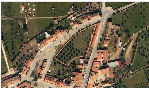
Parcela Nome: Quintal Área: 0,41 ha Nº de Predicação: 210 2A Localidade: Flor da Rosa Ocupação de Solo: Ovinos, pastagem