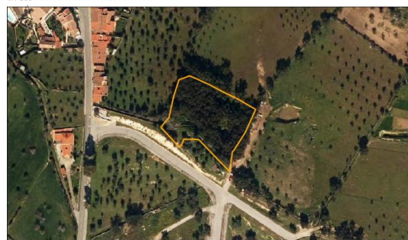
Parcela Nome: CM Crato (Barragem de São Bento) Área: 0,6 ha Nº de Publicação: 230 2A Localização: Flor da Rosa Ocupação de Solo: Pastagem sob coberto arbóreo