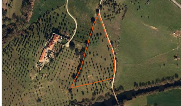
Parcela Nome: Telhados Área: 1,49 ha Nº de Predicação: 65 P Localidade: Crato Ocupação de Solo: Ovinos, pastagem