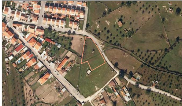
Parcela Nome: Tapada Mano Gordo Área: 2,28 ha Nº de Predicação: 294 J Localidade: Odeon Ocupação de Solo: Pastagem