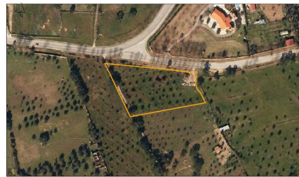
Parcela Nome: Engulhada Área: 0,67 ha Nº de Publicação: 10 Localização: Gálio Ocupação de Solo: Citral, pastagem