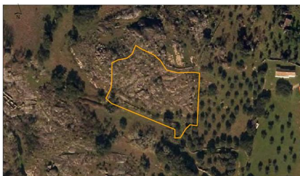
Parcela Nome: Chamgo (1) Área: 0,43 ha Nº de Publicação: 24 J Localização: Monte da Pedra Ocupação de Solo: Pastagem, mato, afloramentos rochosos