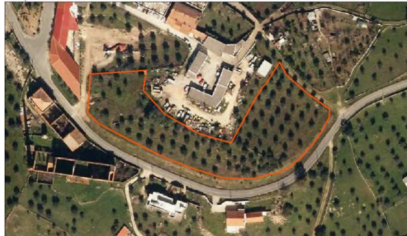
Parcela Nome: Odeon Área: 0,99 ha Nº de Predicação: Ocupação de Solo: Ovinos, pastagem