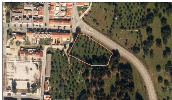
Parcela Nome: Bandelha Área: 0,5 ha Nº de Publicação: 76 0 Localização: Crato Ocupação de Solo: Citral, pastagem