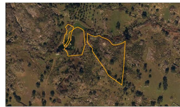
Parcela Nome: Chamgo, Chão dos Casafes, Chamgo Área: 1 ha, 0,27 ha, 0,07 ha Nº de Publicação: 33 J, 36 J, 37 J Localização: Monte da Pedra Ocupação de Solo: Pastagem sob coberto arbóreo, Pastagem, Pastagem