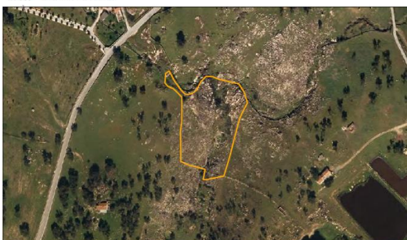
Parcela Nome: Cabins Área: 2,83 ha Nº de Publicação: 21 0 Localização: Crato Ocupação de Solo: Pastagem, mato, afloramentos rochosos